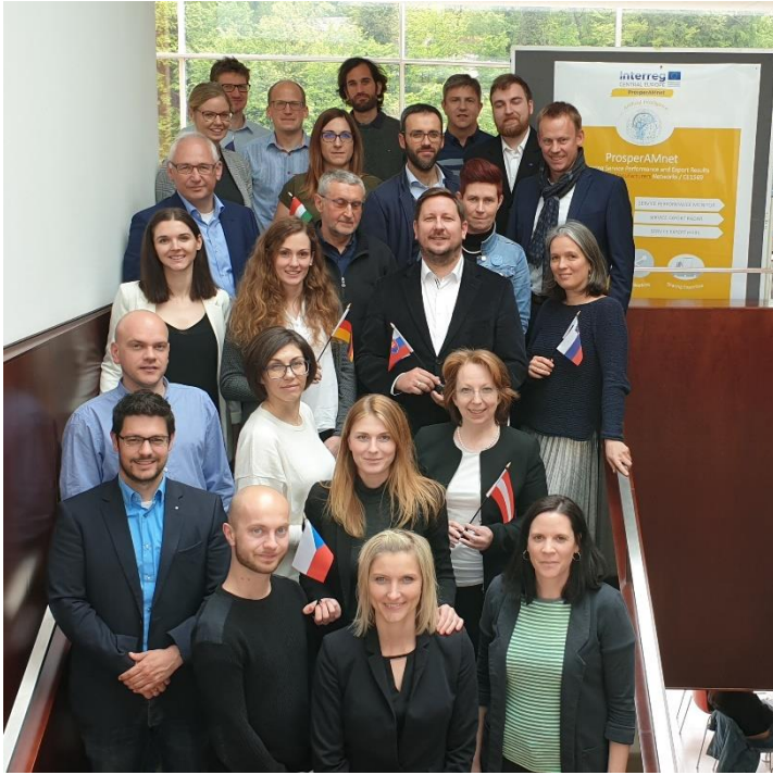
A partnerség csoportfotója a ProsperAMnet projektindító találkozáján, 2019 május 6-7.